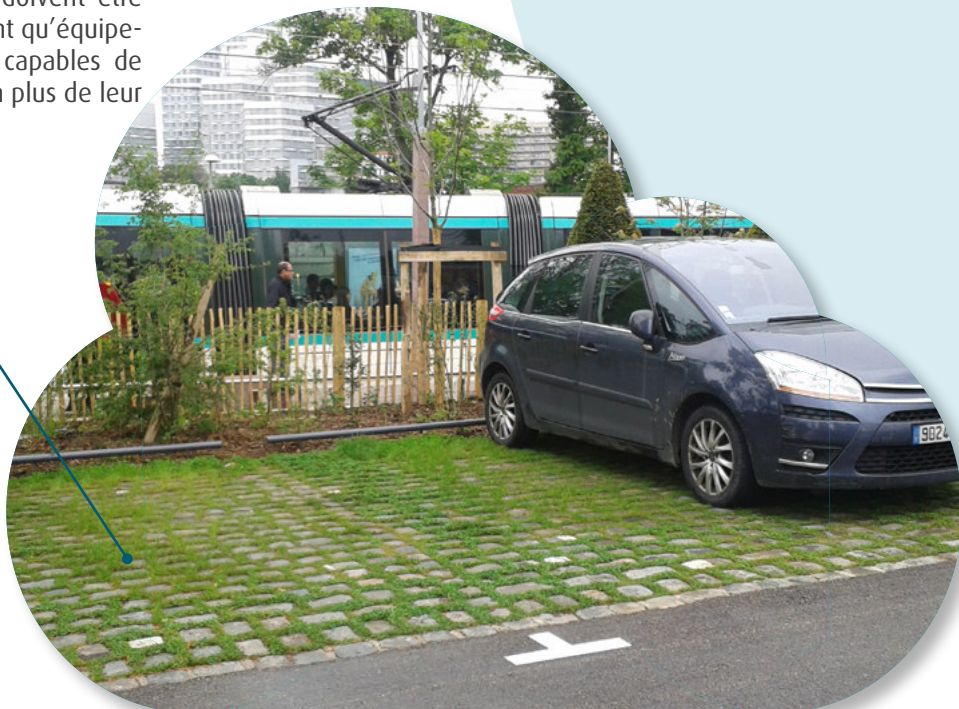
Parking infiltrant évitant l'imperméabilisation, Fresnes (DRIEE)

Dans un projet, comme dans un document d'urbanisme, si les principes d'évitement ne sont pas appliqués (par exemple, si la limitation de l'imperméabilisation n'a pas été suffisamment recherchée), les services de l'État demanderont systématiquement des informations complémentaires, ce qui suspend l'instruction du dossier au titre de la loi sur l'eau. Le maître d'ouvrage s'expose à un rejet de son dossier pour incompatibilité avec la réglementation en matière d'eaux pluviales.